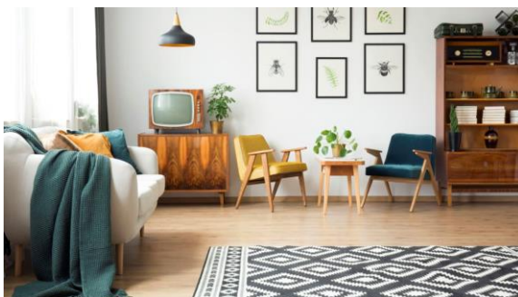
Obrázek 3: Retro styl