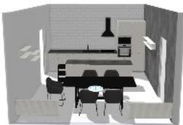
Obrázek 17: 3D návrh kuchyně