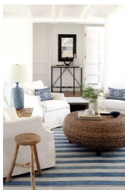
Obrázek 13: Přímořský styl