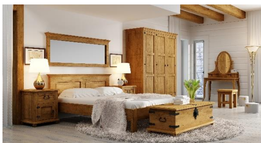
Obrázek 10: Selský - rustikální styl

Inspirací jsou vesnické domy před 20. stoletím. Podlaha je nejčastěji z dřevěných prken, kamenných dlažeb nebo z cihel, nábytek z přírodních materiálů, taky nejčastěji ze dřeva. Barvy jsou hlavně různé odstíny hnědé a bílé. Je to styl využitý hlavně ve vesnických domech. Kdybych já bydlela ve větším domku někde na samotě na vesnici, tak bych se tomuto stylu vůbec nebránila a ráda bych ho měla v celém domu.