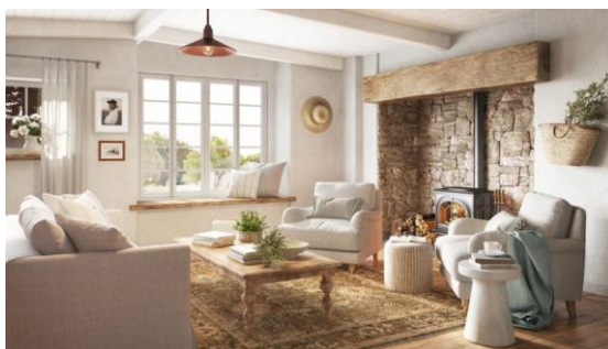
Obrázek 2: Přírodní styl

Už podle názvu lze poznat, že se jedná o design, který využívá přírodní materiály. Typické barvy pro tento styl jsou krémově bílá, světle hnědá nebo tmavě hnědá. Na nábytek a doplňky se využívá vlna, kůže, cihly, kámen, měď a hlavně dřevo. Přírodní styl patří mezi mé nejoblíbenější styly. Líbí se mi, že i v domě je kousek přírody, a myslím si, že to působí velmi příjemně.