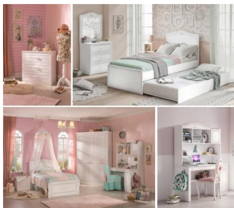
Obrázek 11: Romantický styl