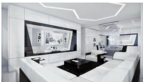
Obrázek 8: High - tech styl

Jedná se o nejmodernější styl, interiér je velmi jednoduchý a bývá nejčastěji v jedné nebo ve dvou barvách. Převažuje barva bílá a neonové barvy, jako třeba fialová a zelená. Vybavené místnosti působí prázdně, protože tam bývá poměrně málo nábytku a doplňků. Styl high – tech může někomu připomínat nějakou vesmírnou místnost, a to kvůli barvám, které se používají. K vybavení se využívá hodně sklo, beton a kov. Já nejsem největší fanoušek tohoto stylu. Nepůsobí na mě příjemně, a kdybych měla vybavený dům tímto stylem, tak bych se tam necítila úplně nejlépe. Nejvíce se můžeme se stylem high – tech setkat v moderních hotelech.