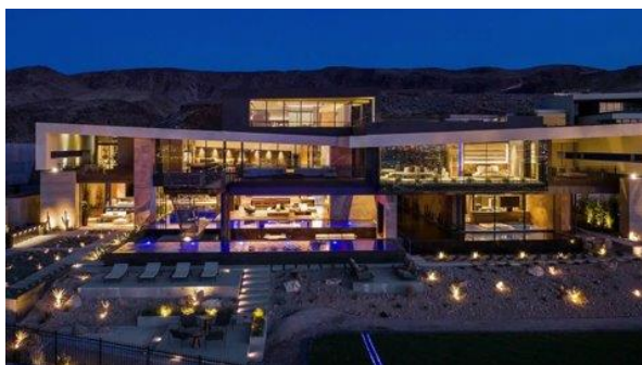
Obrázek 15: Vila v Las Vegas

Úplně nejraději se dívám na videa Enese Yilmazera, který točí na YouTube delší videa v angličtině, ve kterých dělá prohlídky vil převážně v Americe. Ve videích vždy zmíní, kolik vila stojí, jak je velká, kolik je v ní místností a kde se nachází. Já jsem viděla většinu jeho videí, ale jen jedna z vil se mi stále promítá v hlavě, a to vila v Las Vegas, která mě zaujala nejen zvenku, ale i zevnitř. Na Netflixu mám ráda seriál Dream Home Makeover, který začal v roce 2020 a má 4 série. Bohužel jsem neviděla všechny díly, protože jsem se na něj začala dívat teprve nedávno, ale zatím podle toho, co jsem už viděla, musím říci, že je to pěkný seriál.