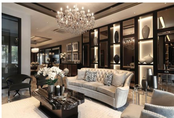
Obrázek 4: Glamour styl

Styl Glamour je charakteristický spíše temnými barvami, takže se hodně využívá černá, tmavě hnědá nebo třeba zlaté a stříbrné doplňky. Nábytek je často z kůže nebo tmavého dřeva. Glamour styl je podle mě pěkný, jen když není moc výrazný. Více mi vyhovuje, když je design decentní, třeba černá, šedá a do toho stříbrné doplňky, ale nelíbí se mi kombinace červené, černé a zlatých doplňků.