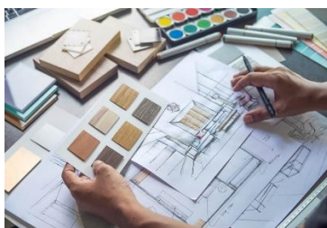
Obrázek 1: Návrh

Bytový design se zabývá vybavením a zútulněním místností v bytech a domech. Úkolem bytového designéra je nejen vybavit byt či dům podle požadavků zákazníka, ale i uspořádat všechnen nábytek tak, aby byl v místnosti praktický a aby byl prostor v místnosti dobře využitý. Velmi důležité je umět dobře kombinovat věci, například v kuchyni vyberete podlahu, která se nebude hodit k barvě kuchyňské linky, a hned to může zkazit celý vzhled kuchyně. Důležité je také používat kvalitní materiály.