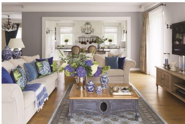
Obrázek 12: Francie - venkov

Francouzský styl je typický tím, že je velmi prosvětlený. Barva stěn je bílá, nábytek je často ze dřeva, které je natřené na bílo, a doplňky jsou také bílé třeba s fialovými detaily a květinami. Dalo by se říct, že je to také tak trochu romantický styl, ale líbí se mi mnohem víc. Mám ráda bílou, fialovou a dřevo natřené na bílo. Rozhodně bych ho zařadila do mých oblíbených stylů.