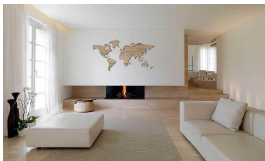
Obrázek 9: Purismus, minimalismus