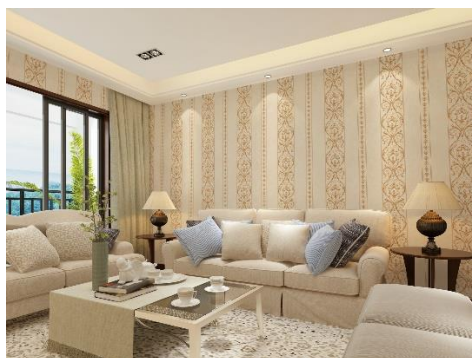
Obrázek 7: Příměstská moderna