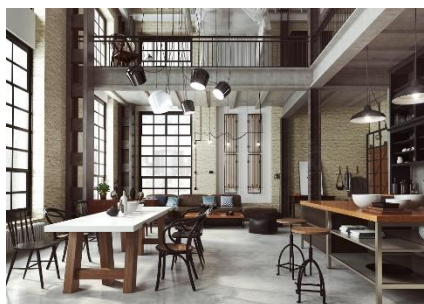
Obrázek 14: Styl Loft

Styl loft má typické vysoké stropy, kovové doplňky, betonové podlahy. Zvláštností tohoto stylu je, že místnosti nejsou odděleny stěnou. Typickou barvou je šedá, hnědá, černá nebo bílá. Jako nábytek se využívají staré kousky. Loft se mi také líbí a patří mezi oblíbené.