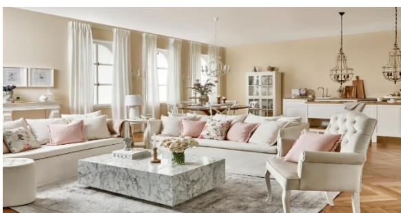
Obrázek 6: Městská klasika

Městská klasika je inspirována dřívějšími vilami. Je to velmi čistý a jednoduchý design. Používají se drahé materiály, jako je mramor nebo doplňky vyrobené z hedvábí a vlny. Barvy jsou hlavně bílé a krémové. Musím dodat, že právě tenhle styl se mi dost zalíbil a teď patří mezi mé oblíbené.