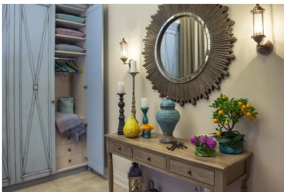
Obrázek 5: Vintage styl