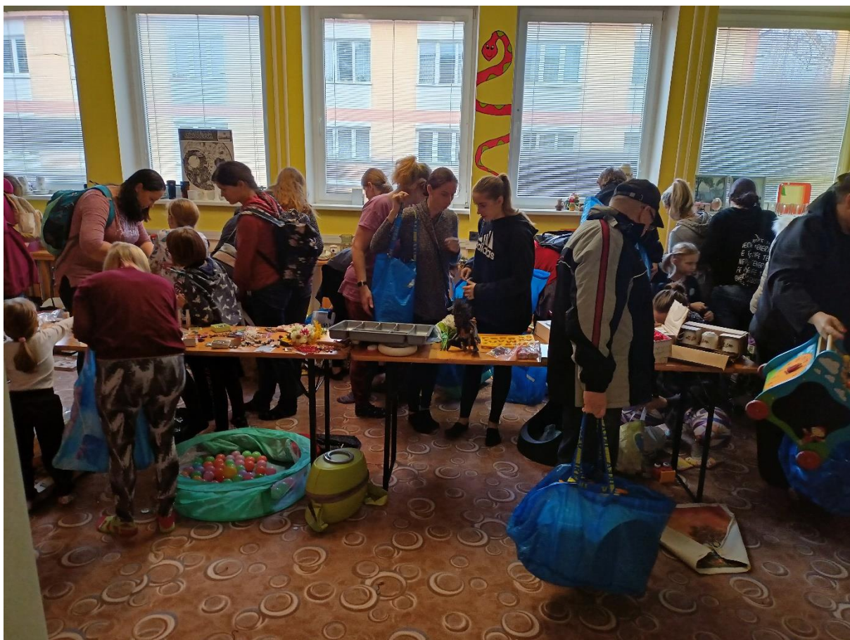
Obrázek 5: Klasický Swap