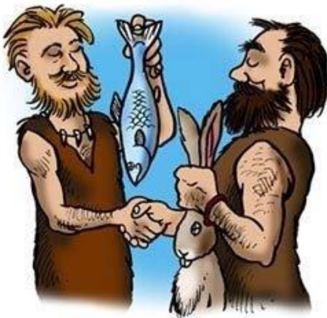
Obrázek 3: Výměnný obchod

Jedna z variant, jak se lidé dozvídají o Swapu, je hlavně od známých a kamarádů, kteří tyto akce znají. Jak už jsem zmínila, k šíření této myšlenky hodně pomáhá Facebook a jiné sociální sítě. Naše Swapy mimo hlavní stránky Facebooku propagujeme hlavně v blanenském deníku Monitor a v přehledu kulturních akcí na stránkách města Blanska.