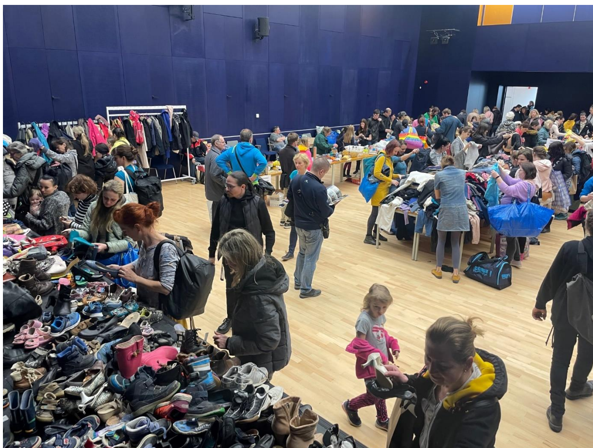
Obrázek 2: Swap Kuřim

Tato další možnost je mezi veřejností rozšířenější. Pořadatelé si mohou zvolit, kolik dní potřebují. Občas to bývají dva dny, někdy týden. Záleží na organizátorech. Vše, co jste vytrídili, předáte pořadatelům, kteří to za vás roztrídí. Od té chvíle si můžete projít místnost, kde je vše uloženo. Počet věcí, které si odnesete, je libovolný. Občas si nic nevyberete a někdy si odnesete plnou tašku. Když přijdete na tento styl Swapu, je lepší tam zůstat delší dobu, abyste měli větší výběr.