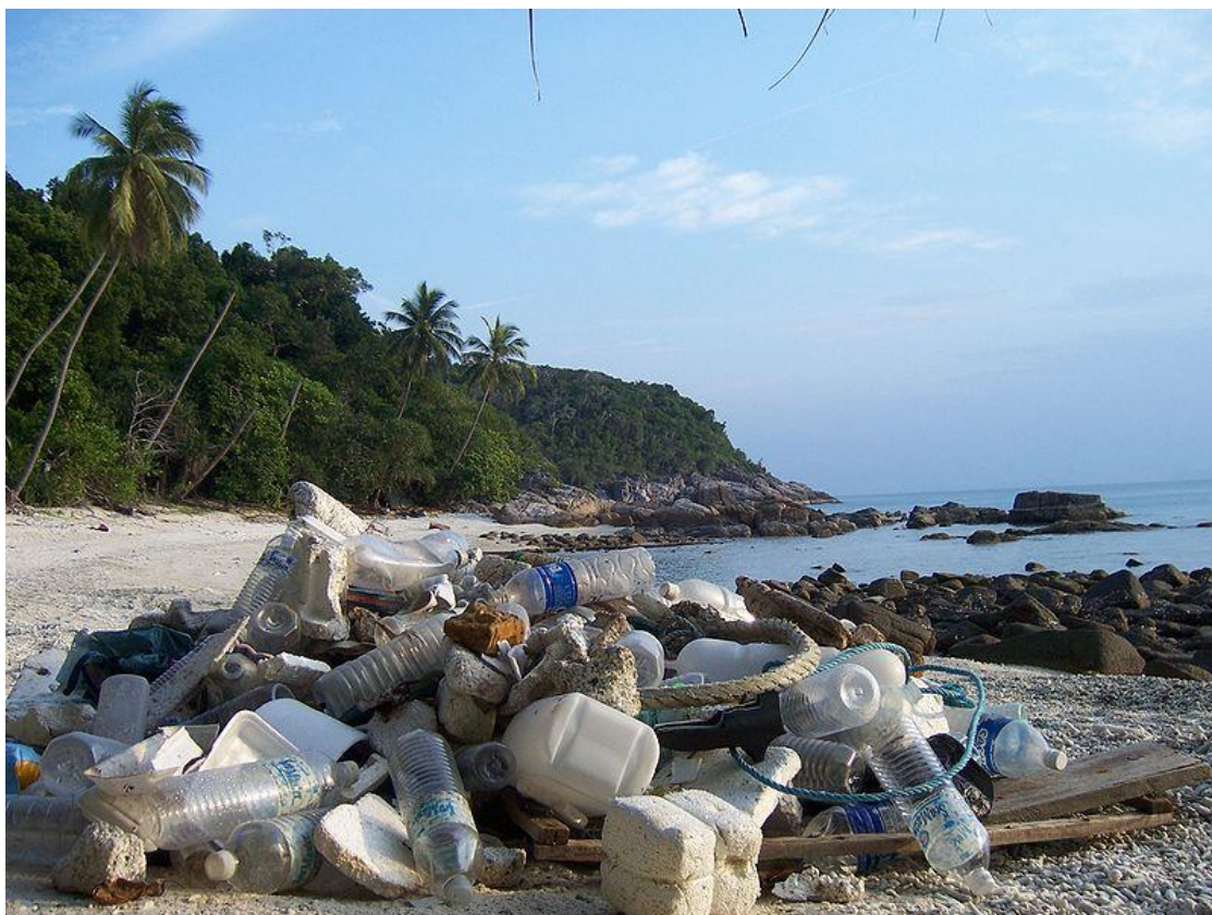
Obrázek 4: Odpadky na pláži Perhentian Kecil

Jedna z hlavních výhod pro planetu je šetření životního prostředí, protože třídění odpadu není dostačující. Objevují se stále nové kolekce oblečení nebo doplňků, které by za půl roku lidé vyhodili, protože už nejsou v módě. Díky Swapu kolují věci mezi lidmi, takže není potřeba kupovat stále něco nového.