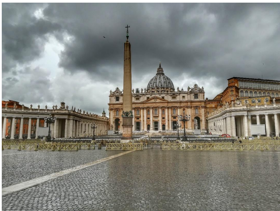
Obrázek č. 4 - bazilika sv. Petra

Je nazývána také jako Svatopetrský dóm nebo Vatikánská bazilika. Je jednou ze čtyř římských papežských bazilik. Jedná se o nejvýznamnější budovu celého Vatikánu. Stojí na Svatopetrském náměstí hned vedle Apoštolského paláce a vatikánských muzeí. Do baziliky vede celkem šest vchodů. Jedny dveře jsou uprostřed a jsou bronzové. V podloubí je pak ještě pět vchodů, které vedou do atria. Vnitřní část baziliky je pokryta mnoha malbami, ozdobami a sochami. Jedna ze soch, která se v bazilice vyjímá, je socha Mojžíše vytvořená italským sochařem Michelangelem Buonarrotim. Uvnitř je i možnost se jít podívat do jedné hrobky.