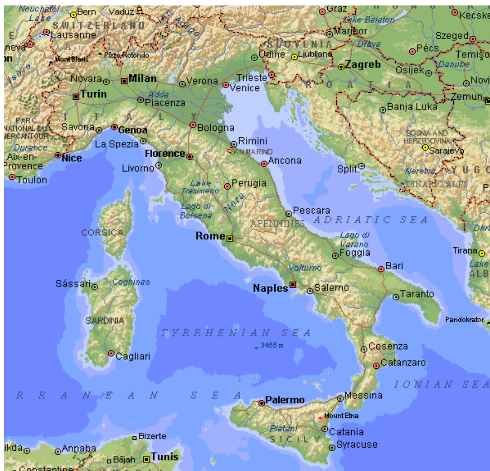
Obrázek č. 1 - mapka Itálie

Minulý rok jsem v rámci poznávacího zájezdu navštívila Itálii společně se svojí mámou a mladší sestrou. Rozhodla jsem se tedy, že o této zemi napíšu svoji závěrečnou práci. Nejprve popíšu, kde Itálie leží, její podnebí, zdejší obyvatelstvo a náboženství. Uvedu památky, které jsem navštívila, a jejich charakteristiku. Průběžně se zmíním také o samotném zájezdu. Samozřejmě také nemůžu zapomenout na italské jídlo, které je opravdu vynikající. Na závěr vás seznámím s vlastními zážitky z Itálie a svým pohledem na život v Itálii. Chtěla bych, aby moje práce byla inspirací pro ostatní. Aby poznali, že Itálie je velmi okouzlující země a bezpochyby stojí za to se tam někdy podívat. Moje práce by mohla být užitečná pro ty, kteří váhají, zda se do Itálie vypraví, nebo pro lidi plánující cestu do Itálie, aby měli předem informace o zdejších památkách.