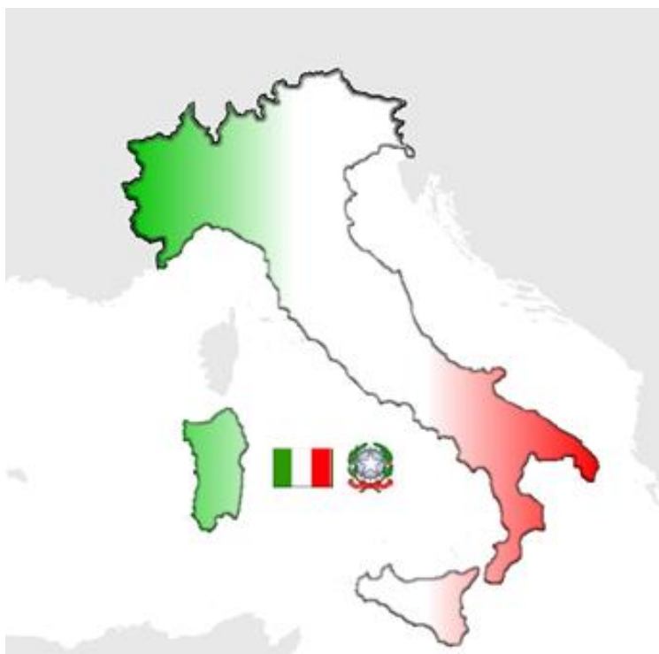
Obrázek č. 2 - mapka v barvách státní vlajky, vlajka a znak

Italové jsou nadšení fotbalem. Po celé zemi je velké množství stadionů a fotbal se tady hraje na velmi dobré světové úrovni.