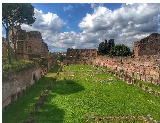
Obrázek č. 16 – Palatin

Nedaleko od Kolosea je k vidění vrcholek Palatin, kde se nachází pozůstatky antických staveb, např. stadion s tribunou a pozůstatky lázní Septima Severa. Jsou zde i nádherné Farneské zahrady, které patřily k prvním botanickým zahradám v Evropě. Z vyhlídkové terasy je vidět celé Forum Romanum jako na dlani.