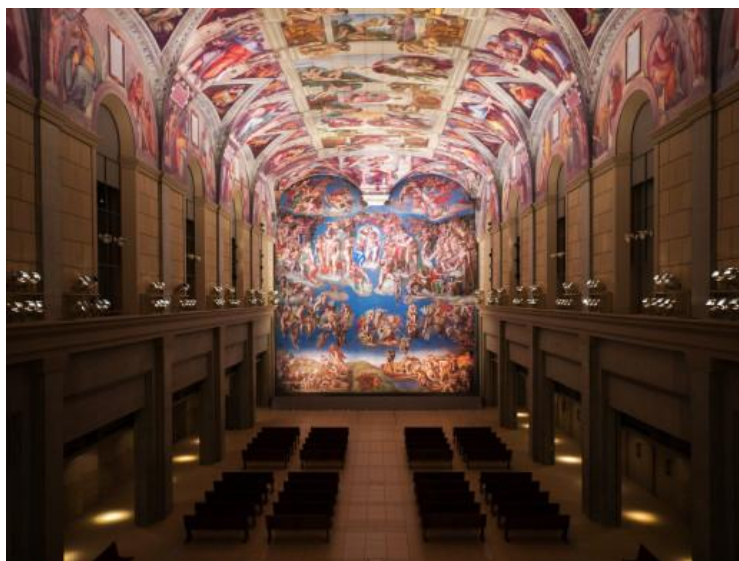
Obrázek č. 6 - interiér Sixtinské kaple

Do vatikánských muzeí jsme se z časových důvodů nedostaly. Dlouhé hodiny jsme v dešti stály ve frontě, ale nakonec jsme to musely vzdát. Velmi nás to mrzelo, ale je to pro nás výzva podívat se sem při nějaké další cestě.