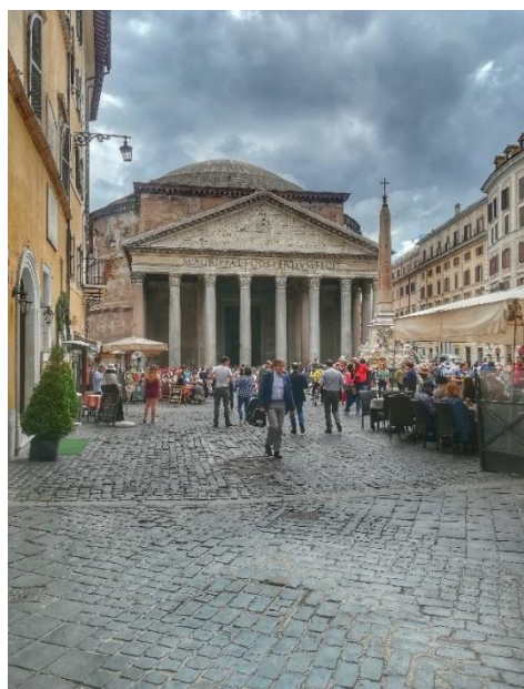
Obrázek č. 18 - Pantheon

Je to zřejmě nejzachovalejší antická památka. Nechal ho postavit císař Hadrián. Stavba má kruhový půdorys. Zvláštností je stejná výška a šířka. Uprostřed kopule je otvor, kterým se dovnitř dostává světlo. Věřící zde mohli rozjímat při pohledu na nebe. V podlaze je dvacet dva děr, kterými je odváděna voda, která se dostane dovnitř právě tímto otvorem. V Pantheonu byly ukládány ostatky významných osobností.