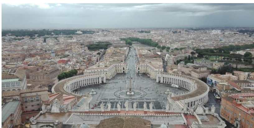
Obrázek č. 3 - Svatopetrské náměstí

Na fotografii vypadá mnohem menší než ve skutečnosti. Je nejvýznamnějším náměstím v Římě. Může se zde shromáždit až neuvěřitelných 400 000 lidí. Svou krásou se může chlubit hlavně díky bazilice sv. Petra. Velkou dominantou je také sedmnáct metrů široká kolonáda s dórskými sloupy. Jsou vždy čtyři v jedné řadě a každý měří 15 metrů. Na obou stranách kolonády jsou na ní nahoře umístěné sochy svatých. Uprostřed náměstí se tyčí obrovský obelisk. Dovolím si také zmínit jednu zajímavost, kterou jsem se dozvěděla od pana průvodce. Když si ve střední části náměstí stoupnete na označené místo na zemi a podíváte se směrem ke sloupům v jakémkoliv úhlu, neuvidíte čtyři sloupy v každé řadě, ale vždy jen jeden.