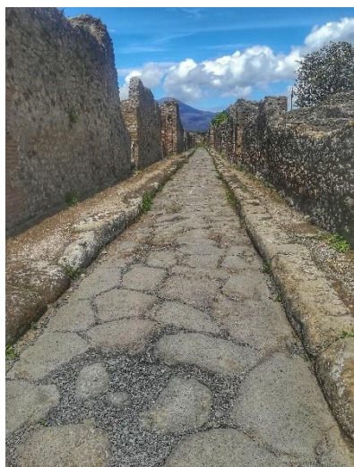
Obrázek č. 11 - ulice v Pompejích