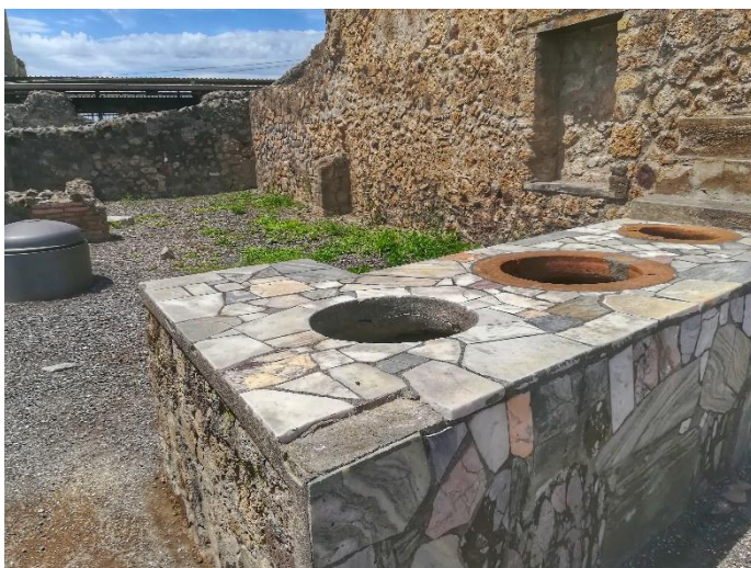
Obrázek č. 12 - rychlé občerstvení

Velmi zajímavé byly i místní lázně. Už tenkrát měli velmi dobře vymyšlené, kde se lidé zahřívali a pak následně chladili v kaledáriu. Stropy v zahřívacích místnostech byly opatřené vroubky, které zamezily kapání vody na zem, ale pomohly stékání podél zdi na zem. Prohlídka celého města by mohla trvat i několik dní. Procházka dlouhými ulicemi a prohlížení všech zákoutí jsou velmi působivá.