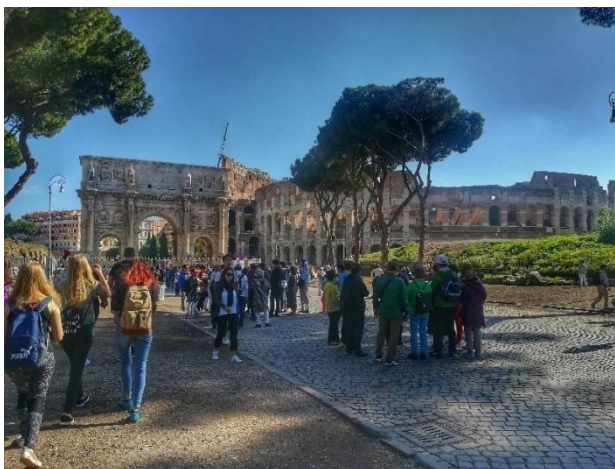
Obrázek č. 15 - Konstantinův oblouk a Koloseum

U Kolosea stojí Konstantinův oblouk (Arco di Costantino). Byl postaven římským lidem a senátem na oslavu vítězství Konstantina v bitvě u Milviova mostu. Je ozdobený reliéfy 3 s historickými motivy.