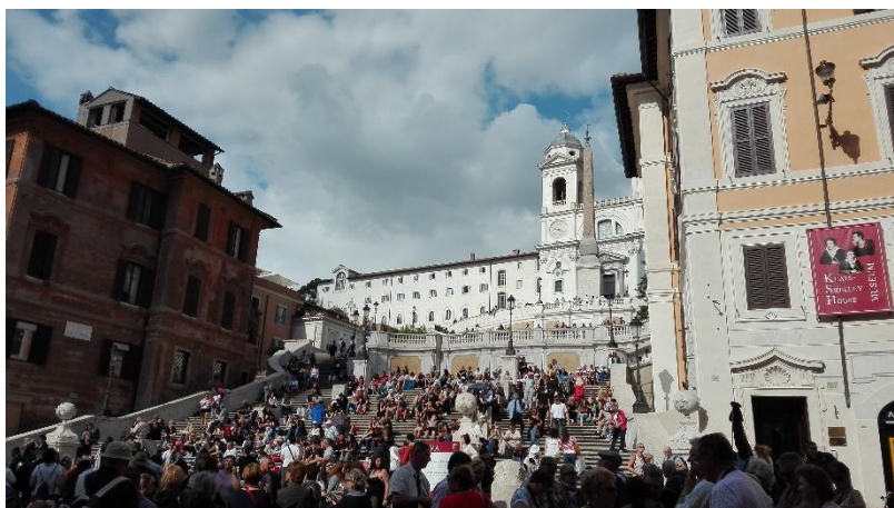
Obrázek č. 20 - Španělské schody