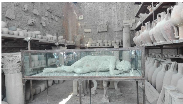
Obrázek č. 10 - sádrový odlitek zemřelého

Na své odhalení Pompeje čekaly až do 19. st., kdy tady probíhal rozsáhlý archeologický výzkum. Postupně byly odhalovány zasypané budovy. Archeologové používali speciální techniku odhalování pozůstatků zemřelých lidí. Vždy, když narazili na dutinu, vylili ji sádrou a po zatvrdnutí ji šetrně odhalili. Získali tak unikátní a zcela věrné podoby lidí, kteří byli v Pompejích zaživa pohřbeni. Kromě toho je zde k vidění řada používaných nádob a pozůstatků fresek s erotickým nádechem.