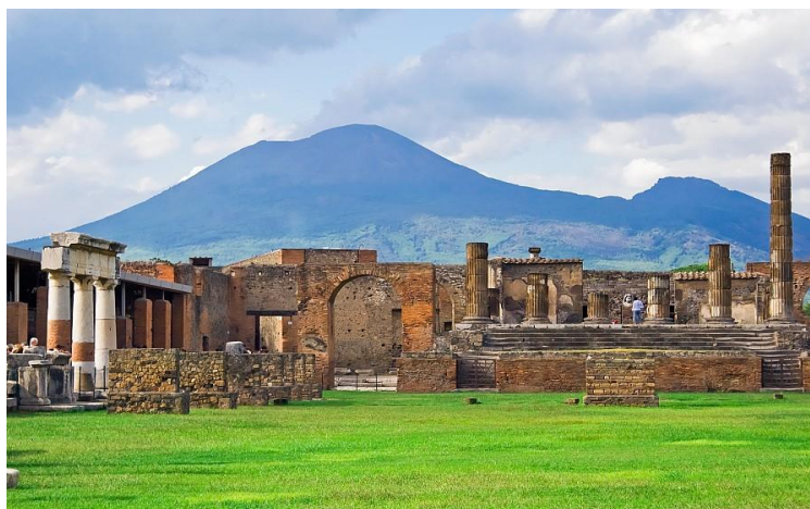
Obrázek č. 13 - sopka Vesuv

Po dalším náročném dni následoval odpočinek a načerpání sil na poslední den v Římě.