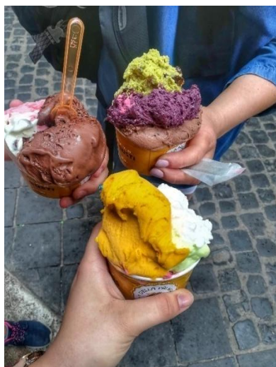
Obrázek č. 22 - italská zmrzlina

Mezi velmi oblíbené italské dobroty patří zmrzlina. Mají nekonečně mnoho druhů. My jsme měly tu možnost navštívit poslední den v Itálii cukrárnu, kde bylo přes 100 druhů zmrzlin. Od vanilkové a čokoládové až po ty nejbáznivější příchutě. Člověk si tady připadal jako ve snu.