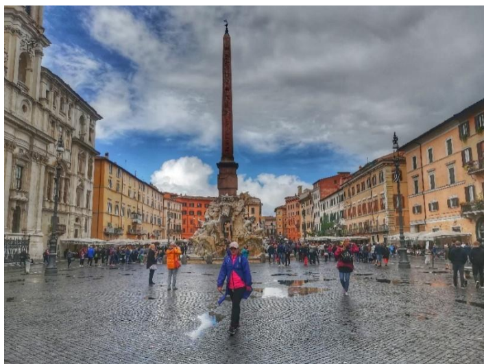
Obrázek č. 8 - Piazza Navona