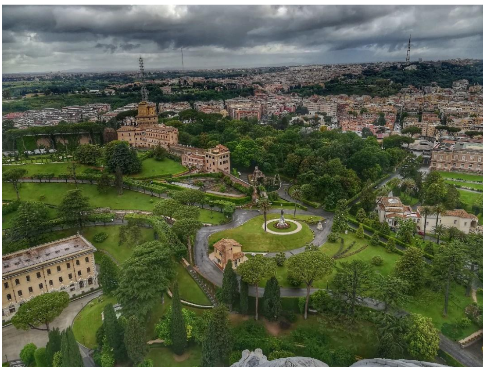
Obrázek č. 5 - vatikánské zahrady - výhled z kopule baziliky sv. Petra

Kopule baziliky sv. Petra váží neuvěřitelných 14 tisíc tun. Je vnější dominantou baziliky. Lze se do ní dostat po schodech, které se neustále stácejí. Schody jsou sice nejdříve široké a nejsou moc vysoké, ale postupně se rapidně zužují a jsou čím dál vyšší a vyšší. Někdo by zde mohl mít strach z malých prostor. Každopádně my jsme tenhle strach překonaly a musím přiznat, že to za ten výhled na celý Vatikán a Řím opravdu stálo. Z vrcholku kopule je možné spatřit celé Svatopetrské náměstí a jeho okolí. Jsou pak odtud také vidět nádherné, běžně nepřístupné, vatikánské zahrady, Sixtinská kaple a Apoštolský palác.