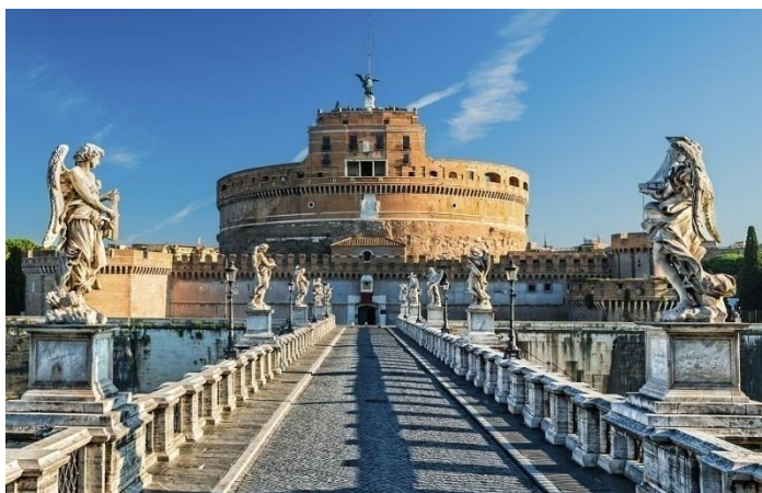
Obrázek č. 7 - Andělský hrad