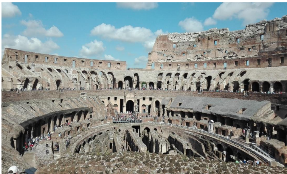
Obrázek č. 14 - Koloseum

Do roku 2000 bylo Koloseum zobrazeno na lící straně olympijských medailí, dodnes je na rubu pěticentové euromince.