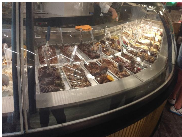
Obrázek č. 23 - italská cukrárna

Nápoj, který je v Itálii také velmi oblíbený zvláště u dospělých, je bezpochyby káva. Za nejlepší značky italské kávy se považuje káva Illy, Lavazza, Segafredo a mnoho dalších. Lidé si ji zamilovali díky její vynikající chuti a výraznému aroma. Mnoho Italů za den vypije velké množství šálků kávy. Je pro ně typické zastavit se v kavárně jen na malou chvíli a dát si u baru jeden šálek, tzv. piccolo. Tato káva je levnější než ta, kterou si mohou vychutnat při posezení u stolu.