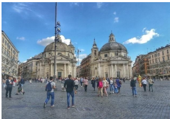
Obrázek č. 21 - Piazza del Popolo

Zde naše putování dosáhlo svého konce, nedaleko odtud jsme nastoupili do příměstského vlaku, který nás odvezl na místo, kde na nás čekal náš autobus. Odtud jsme již putovali směrem k domovu. Čekala nás dlouhá cesta přes noc. Následující den v dopoledních hodinách jsme se vrátili zpět do Brna. Unavení, ale plní zážitků, které bychom přáli i dalším.