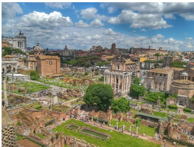
Obrázek č. 17 - Forum Romanum

V dalších obdobích docházelo k zemětřesením a zanesením tohoto místa nánosy bahna. Až teprve v 18. a 19. století se začalo s archeologickými výzkumy a postupně byly odhaleny pozůstatky staveb. Jedním z prvních byl oblouk Septima Severa, dále např. chrám Julia Caesara, Titův oblouk, Saturnův chrám, Vestin chrám, budova senátu (Curia). Uprostřed bylo vydlážděné náměstí Foro, kde se scházela veřejná shromáždění. K vidění je zde skutečně velké množství těchto staveb, ale nejpůsobivější je atmosféra a velikost celého tohoto místa.