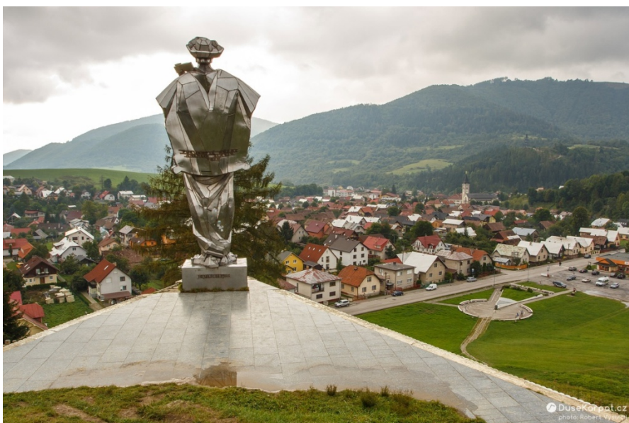
Obrázek 21 -výhled na Těrchovou