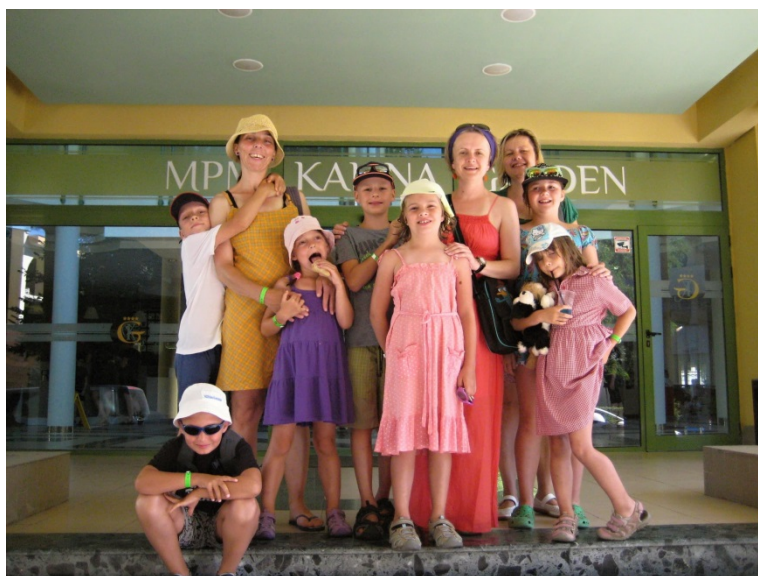
Obrázek 8- společná fotka před hotelem v Bulharsku

V roce 2015 jsme rozhodli pro velkou změnu. Místo hor jsme zvolili pláž a moře Slunečného pobřeží v Bulharsku.