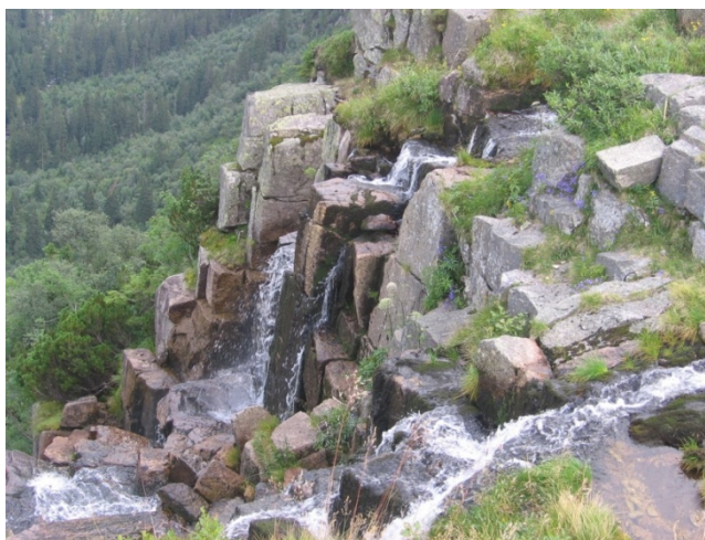
Obrázek 13 – Pančavský vodopád

Název má původně německé kořeny, pochází ze slova pantschen, což v českém překladu znamená šplouchat. Bývá také nazýván ozdobou Labského dolu. Přezdívku dostal díky výhledu do Labského údolí, na které je ze samého vrcholu při pěkném počasí nádherný výhled. Spolu s údolím se tedy staly jednou z nejnavštěvovanějších přírodních krás v Krkonoších, a díky své výšce 148 metrů také nejvyšším vodopádem v České republice. Samotný vodopád padá z 1298 metrů nad mořem do 1150 metrů nad mořem. Průtok vody, který vodopádem proteče za vteřinu, je 25 litrů. V zimním období se průtok zvětšuje kvůli tajícímu sněhu. Pančavský vodopád má čtyři možné vyhlídky, ale vzhledem k hojně návštěvnosti turistů je v dnešní době povolen pouze přístup do nejvyšší části vodopádu, kde se nachází Ambrožova vyhlídka, z níž je krásný výhled na široké okolí.