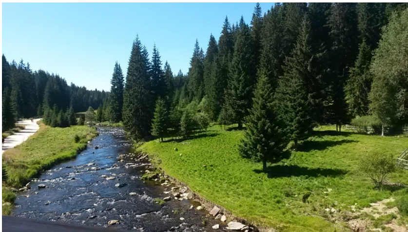
Obrázek 7- Křemelná