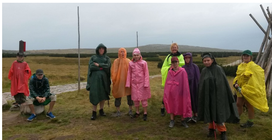
Obrázek 6 - ... i ve špatném počasí dobrá nálada