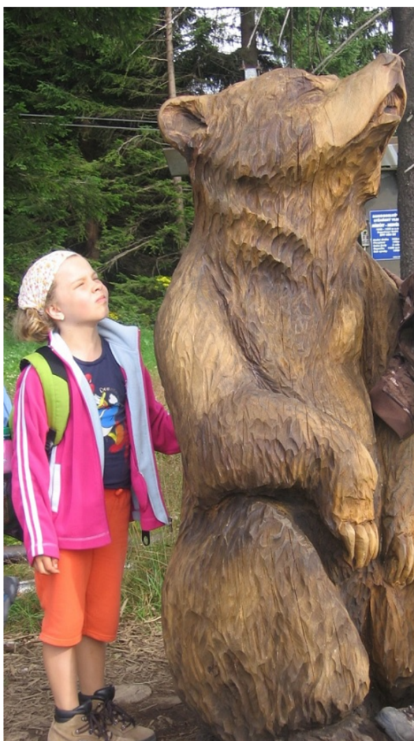
Obrázek 24 - ... teď už jen vyhlížíme další možnou lokalitu

Závěrem bych chtěla poděkovat hlavně maminkám, že se s námi takhle rozhodly jezdit. Doufám, že i několik následujících let budu mít možnost poznávat nová místa a sbírat zajímavé zážitky, na které budu ráda vzpomínat. Jako třeba teď při psaní téhle práce. Jsem ráda, že jsem si tohle téma vybrala a mohla si tedy několik zážitků připomenout. Měla jsem také možnost dozvědět se spoustu nových a zajímavých věcí díky vyhledávání informací o památkách, které jsem v práci zmínila.