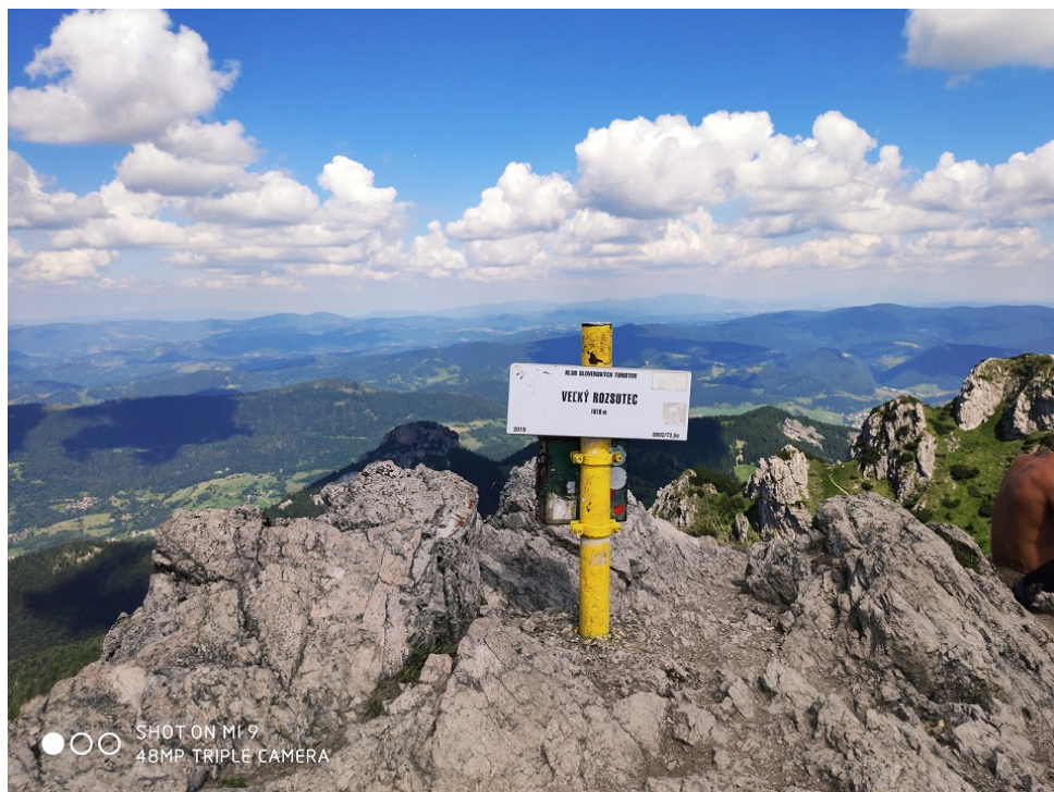
Obrázek 17 - po dlouhé cestě neočekávanější vrcholový bod