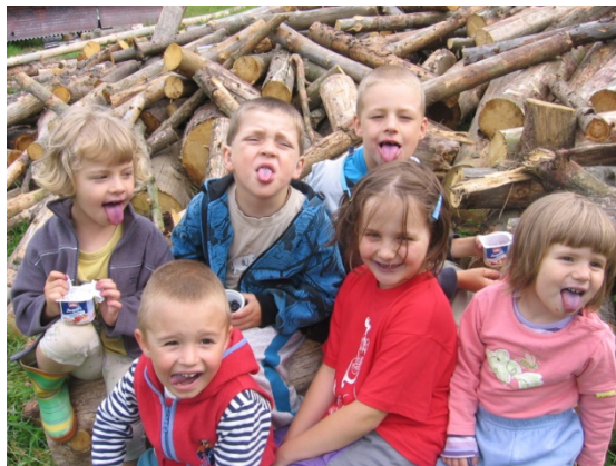
Obrázek 2 – naše „borůvková“ fotografie

Bezvadný výlet byla vždy i cesta lanovkou z Ramzové na Šerák. Mámy nás vždy strašily, že se jednou cestě po vlastních nohou nahoru nevyhneme. A měly pravdu. Minulý rok, vzhledem ke covidu, jsme se nostalgicky do Petříkova vrátili a cesta pěšky se stala skutečností. Jeseníky jsme navštívili celkem šestkrát.