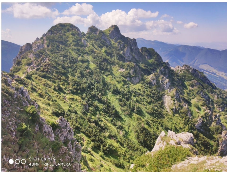
Obrázek 16 - stezka Velkým Rozsutcem