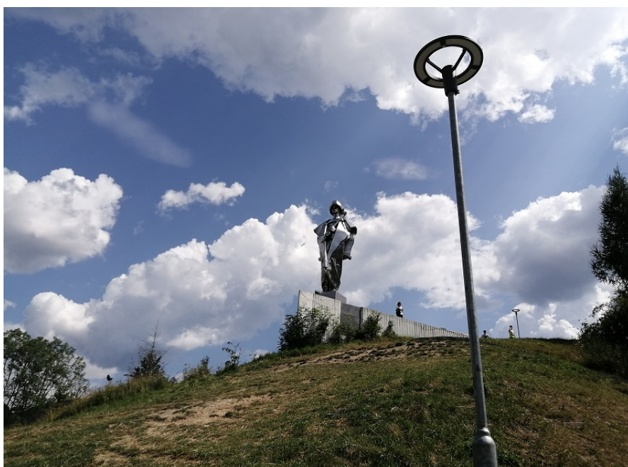
Obrázek 20 - socha Juraje Jánošíka

Muzeum jsme sice nenavštívili, ale sochu ano. Je od ní opravdu krásný výhled na vesničku, neboť socha byla vystavena tak, aby se Jánošík díval směrem na Těrchovou. Byla postavena v roce 1988 k 300. výročí jeho narození. Má více jak 7 metrů a její návrh si zaslouženě připisuje sochař Ján Kulich. Odhalování sochy proběhlo ve dnech, kdy byly ve vesničce slavnosti Juraje Jánošíka, které se tam konají dodnes.