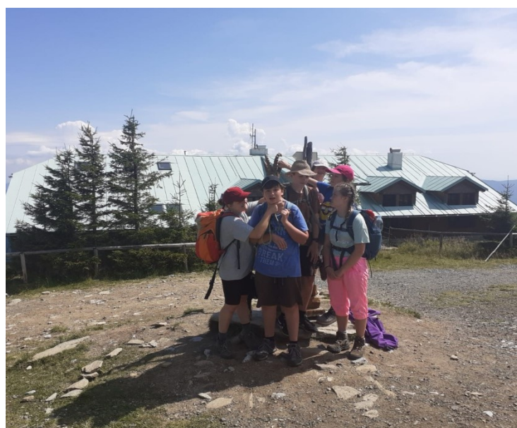
Obrázek 4 – po pěším zdolání Paprsku (srpen 2021)