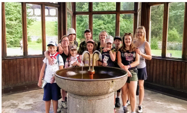
Obrázek 1 – společná fotografie z Jeseníků

Chaloupka v Jeseníkách se nachází u lesa na konci Petříkova. Přes zahradu protéká potůček, který se stal na několik let naším letním osvěžujícím útočištěm. V chaloupce jsme strávili několik prázdnin, než jsme byli schopni ujít pár kilometrů. Zpočátku byly vycházky s pomocí kočárku a krátké po okolí, postupně se kilometry navyšovaly. V lesích jsme sbíraly borůvky a houby. Prvním nejdelším výletem byla cesta na Paprsek, kde jsme měli v restauraci borůvkové knedlíky, ke kterým se vždy při návratu do Jeseníků vracíme. Potom již následovaly návštěva Ramzové, Jeseníku, Karlovy studánky, Pradědu.