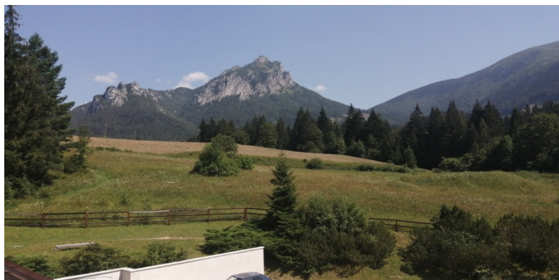
Obrázek 9 - výhled z pokoje na Velký Rozsutec

Za jeden týden jsme stihli jenom minimum místních krás, a tak jsme chtěli následující rok toto místo navštívit znovu. Bohužel nám ale covid s plány zamíchal a návštěvu jsme tedy prozatím nezopakovali.