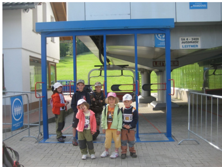
Obrázek 3 – lanovka na Paprsek (2012)