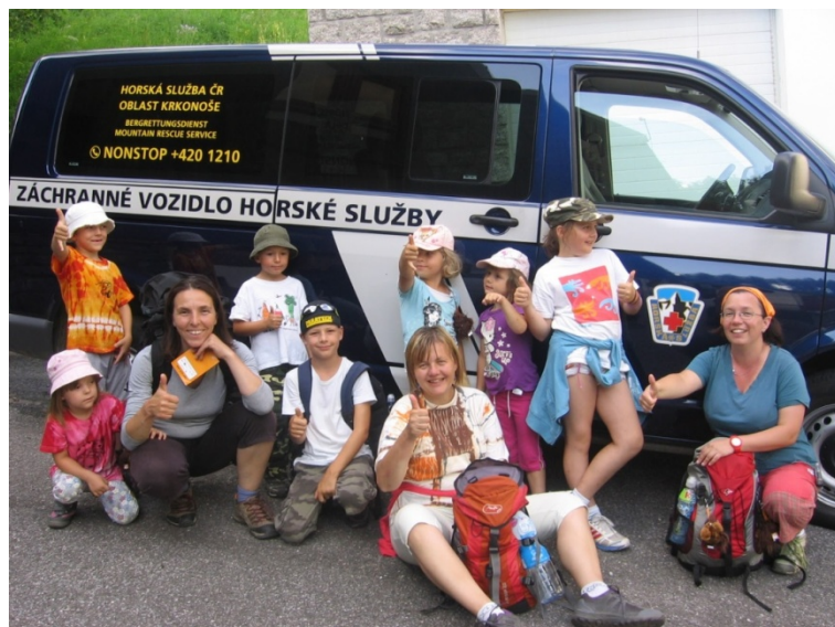
Obrázek 5 – auto Horské služby ve Špindlerově Mlýně

Mámy tak měly o starost méně, že kdyby se něco vážného stalo, máme se na koho obrátit. Krkonoše se nám velice zalíbily, ale poznali jsme tam i zrádnost hor, kdy nám na túře zničehonic začalo pršet, nebo byla vichřice.