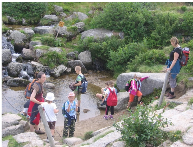
Obrázek 14 – zkouška teploty Pančavského vodopádu