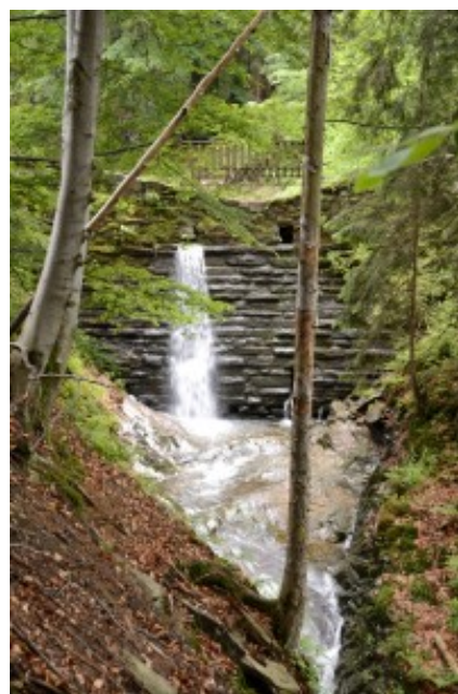
Obrázek 10 - Vražedný potok

Své jméno potok získal na konci první poloviny 17. století, kdy se zde dle pověsti během třicetileté války ukrývali obyvatelé z nedalekého města, dnešní Ramzové, kteří prchali před švédskými vojáky. Jejich úkryt byl vyzrazen a všichni byli následně pobiti Švédy. Než se mu ale Vražedný potok začalo říkat, měl německý název „Mordgraben“. Přes potok vede most, který se začal budovat již v roce 1908, a je tedy nejstarší stavbou tohoto druhu v širokém okolí. Přes potok vedou celkem čtyři přehrážky, které jsou různě rozmístěné. K Vražednému potoku se dostaneme buď z obce Ramzová, anebo ze Šeráku, a to několika cestami.