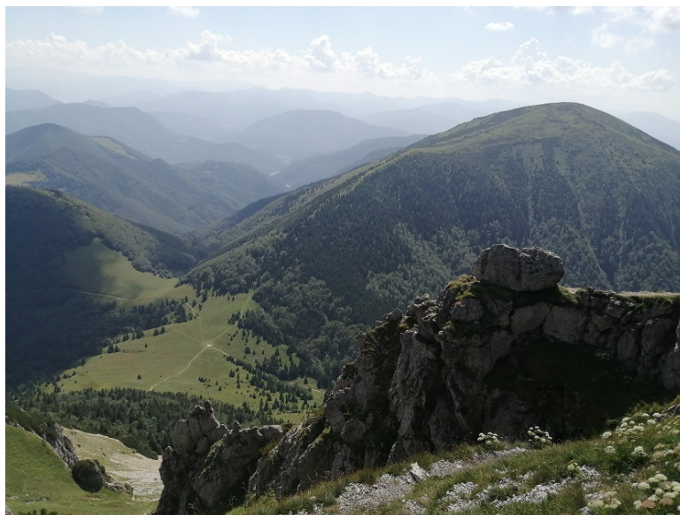
Obrázek 18 - výhled na okolí z vrcholu