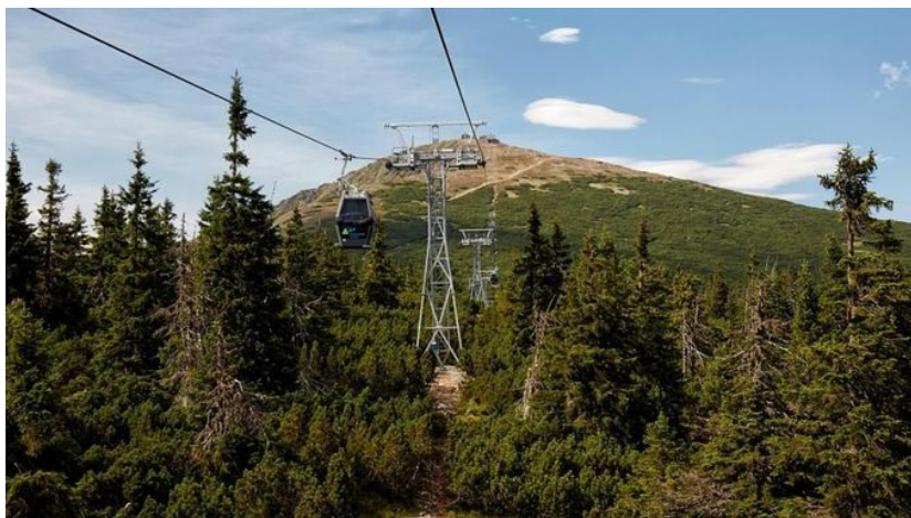
Obrázek 12 - lanovka s výhledem na Sněžku

I cesta ze Sněžky nemusí být nuda a dá se jít několika trasami s různými cíli. Nejnavštěvovanější je trasa přes Luční boudu, ke které se dá z vrcholu dojít do hodiny.