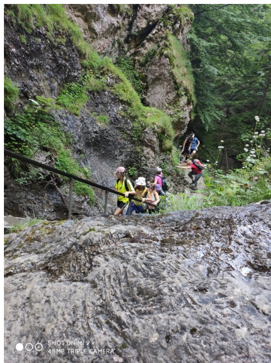
Obrázek 22 - kousek hezké, ale náročné cesty

Jako poslední památku bych ráda představila Jánošíkove diery. Ty jsou také jako jedna z památek v Malé Fatře hojně navštěvované. Rozdělují se celkem na tři části, a to na: Dolné diery, Nové diery a Horné diery. My jsme navštívili všechny a potom jsme pokračovali na Velký Rozsutec, což je jedna z možností, jak diery projít. Některé úseky jsou ale trochu těžší, takže pevná obuv se v tomhle případě více než dost hodila. Cesta je také ztížená o davy turistů. Skalní útvary a prameny jsou jedním z hezkých zážitků.