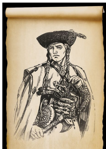
Obrázek 19 - Juraj Jánošík