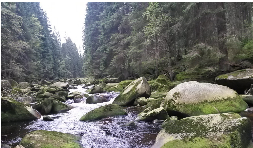
Obrázek 15 – kameny u stezky Povydrí

I když jsme Šumavu navštívili pouze jednou, stihli jsme prozkoumat několik krásných přírodních památek. Ráda bych vás seznámila s jednou z nich, a to řekou Vydrou, kolem které vede cesta, jež je jedna z hojně navštěvovaných turisticky naučných stezek.