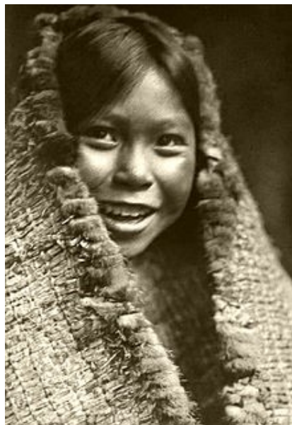
Obrázek 4 – dívka z kmene Métisů

Métisové představují kmen, který mluví anglicky, francouzsky nebo křížšsky a vyskytuje se hlavně v Kanadě. V Kanadě se jich pohybuje celkem sto tisíc. V 18. století uzavřelo mnoho obchodníků a lovců přátelské vztahy s původními obyvateli prostřednictvím sňatků s domorodými dívkami. Někteří z těchto párů odešli do oblasti Red River a vytvořili zde komunity. Jejich potomci byli prvními Métisy, nazývaní „Míšenci od Red River“. Métisové se dnes žijí převážně jako farmáři, drobní podnikatelé nebo státní zaměstnanci. V minulosti se živilí hlavně lovením a obchodováním.