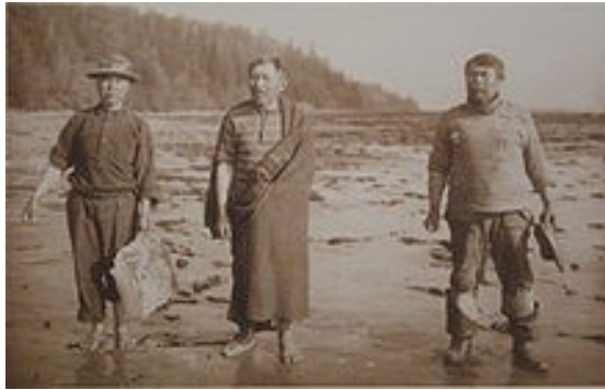
Obrázek 3 – Makahové na pláži