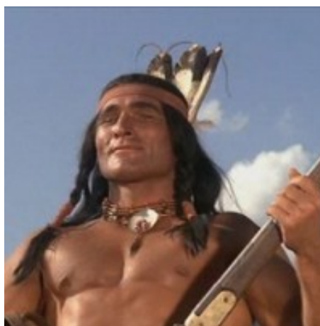
Obrázek 2 – Červený buvol, náčelník Siouxů

I tento kmen se objevuje ve filmové kolekci Karla Maye.