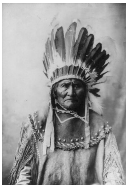
Obrázek 1 – náčelník Apačů

Tento kmen můžeme znát z již zmíněných kolekcí Karla Maye v čele s hlavním hrdinou, Vinnetouem.