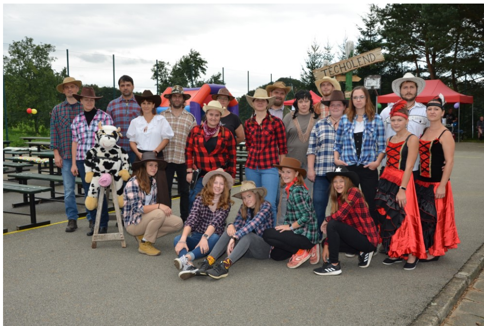
Obrázek 6 – Dětský den na Těchově 2020

házením lasa na umělou krávu. V pozdní odpoledne se losovala tombola plná krásných cen. Poté se všichni rozešli domů a my jsme to tam mohli uklidit.